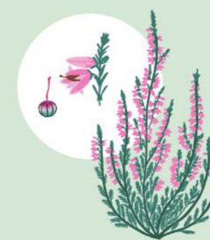
JESENSKA VRESA (CALLUNA VULGARIS)