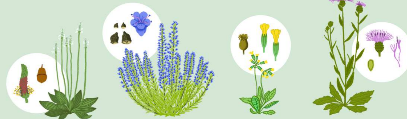
TRPOTEC (PLANTAGO MEDIA)