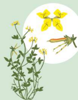
NAVADNA NOKOTA (LOTUS CORNICULATUS)