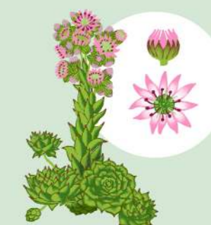
NATRESK (SEMPERVIVUM TECTORUM)