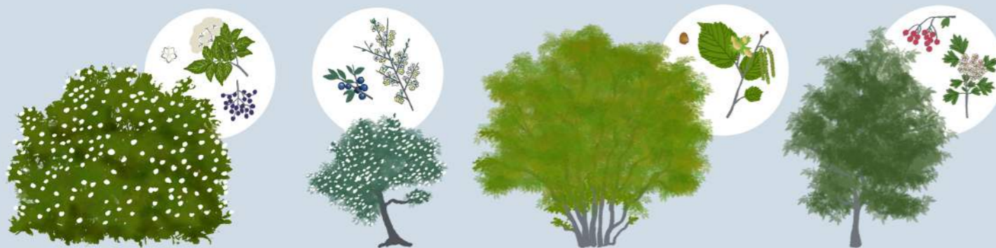
ČRNI BEZEG (SAMBUCUS NIGRA)