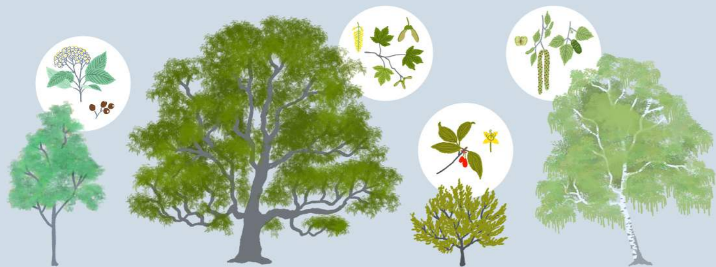
MOKOVEC (SORBUS ARIA)